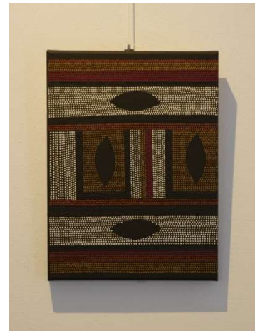
30 x 40 x 4 cm