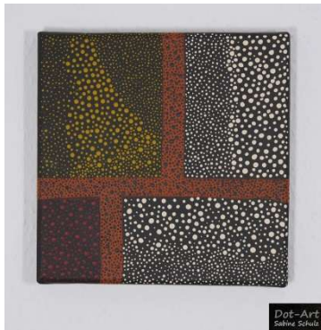
20 x 20 cm